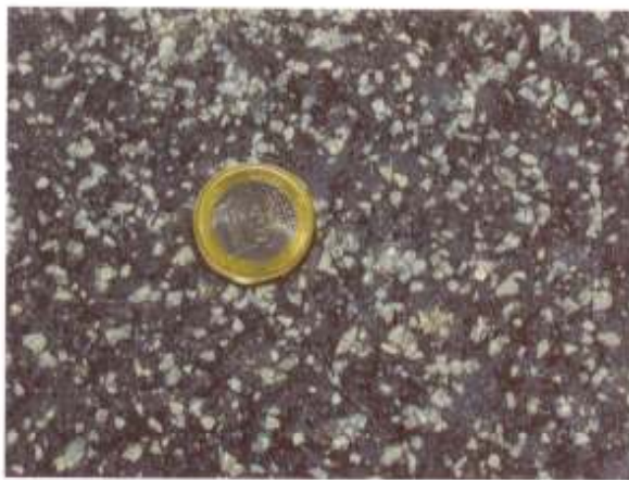
Präzise – die gleichmäßige Verteilung des Edelsplitts.

BOMAG Präzisionsstreuer BS 150* und BS 180* bieten patentierte Streubohlenteknik für ein Maximum an Oberflächengriffigkeit bei gleichzeitig geringem Zeit- und Kostenaufwand. Sie sind mit StVZO Beleuchtung ausgestattet und auf das aktuelle Produktprogramm der schweren schemelgelenkten und knickgelenkten BOMAG Asphaltwalzen abgestimmt.