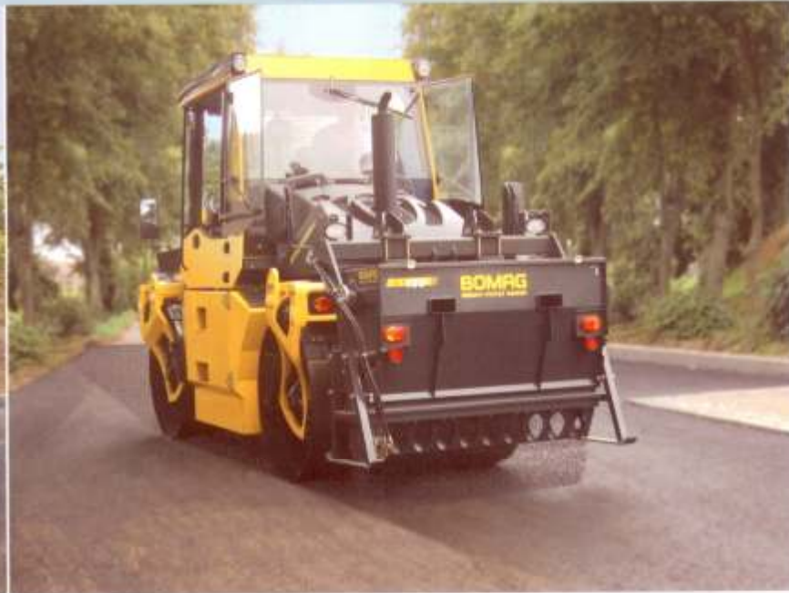
BW 154 AP mit Präzisionsstreuer BS 150.