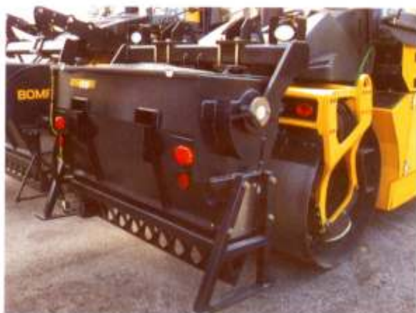
Sicher – die Montage und Bedienung der Präzisionsstreuer.