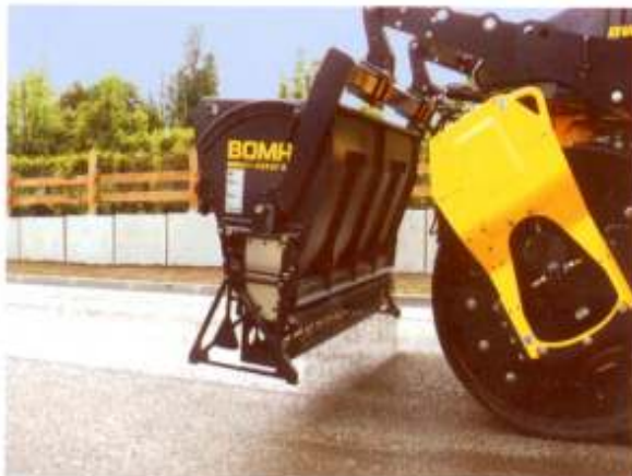
Effizient – die BOMAG Streutechnik spart bis zu 30 Prozent Material.