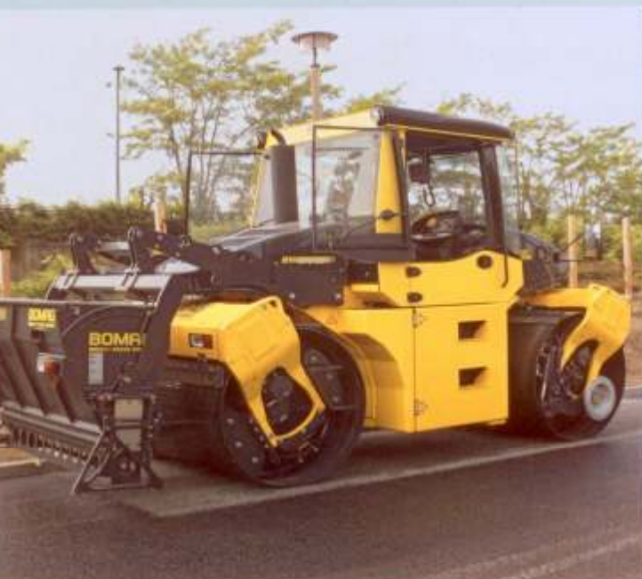
BW 174 AP mit Präzisionsstreuer BS 180.